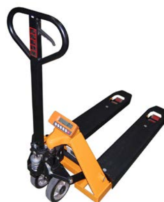
TPS-I 2001 / 2000 / 2005 CH